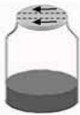
按箭头方向打开西林瓶盖

注意：如有特殊的接种方式、培养时间、温度或培养方式，请详见每种生化鉴定管附带的使用说明。