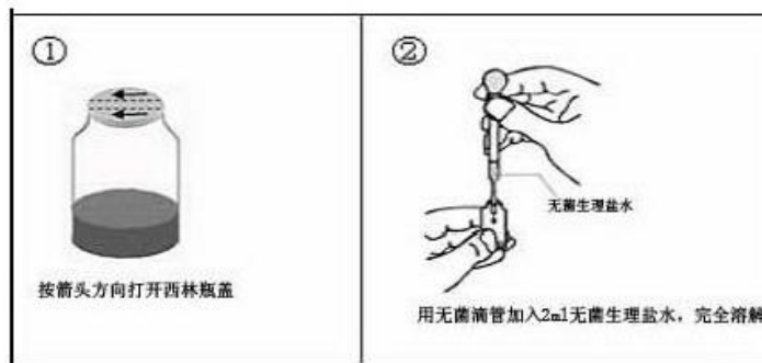
(西林瓶开启示意图)